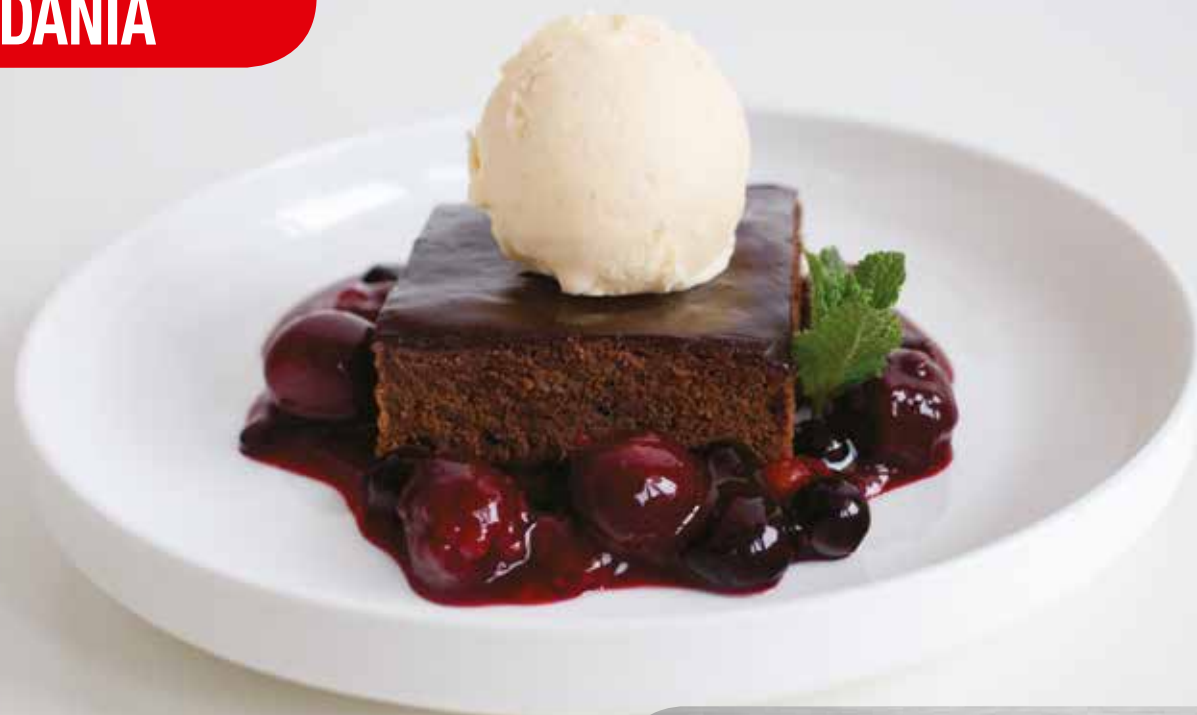
Ciasto czekoladowe z lodami waniliowymi oraz owocami w kisielu